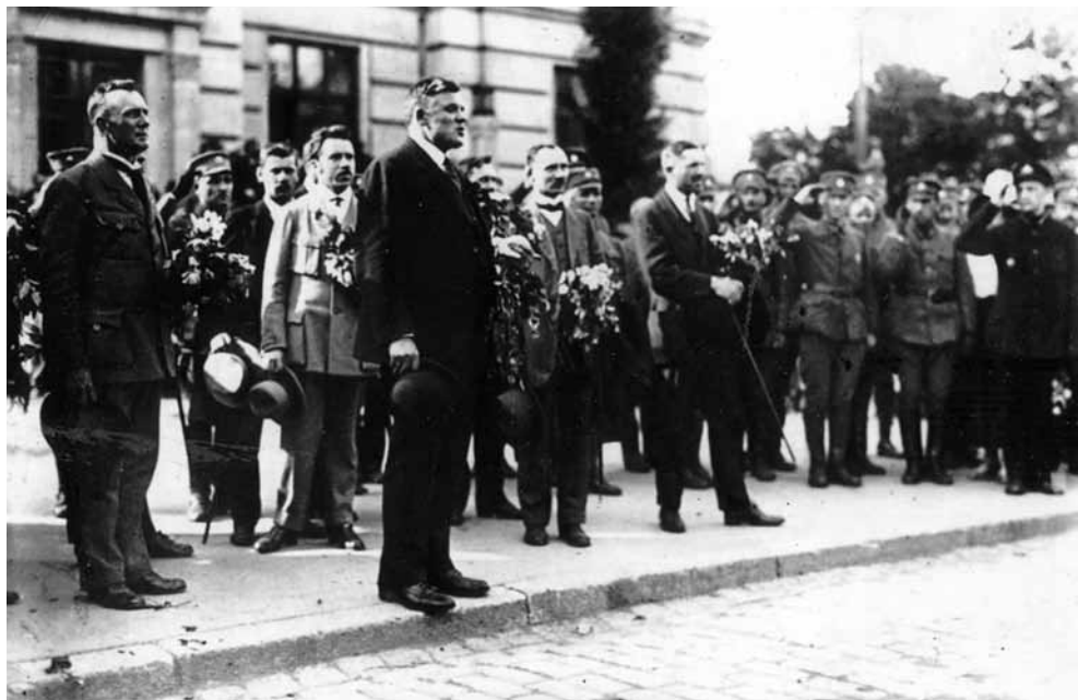
Latvijas Ministru prezidents Kārlis Ulmanis pēc atgriešanās Rīgā Hipotēku biedrības nama priekšā (tagad Latvijas Republikas Ārlietu ministrijas ēka). 1919. g. 8. jūlijs

namiem produktus sniedz pilnīgi par brīvu.” 55 Rīgā 1919. gada jūlijā darbojās 25 sabiedriskās virtuves, kas izsniedza 22 000 bezmaksas pusdienu. Bērnu bezmaksas sabiedriskās virtuves bija arī Rīgas Jūrmalā un tās plānoja drīzumā ierīkot arī citās pilsētās. Cilvēki pie sabiedriskajām virtuvēm sāka stāvēt rindās pusstundu pirms pusdienu izsniegšanas, tikai bērni uz viņiem speciāli ierīkotajām virtuvēm sāka nākt 2–3 stundas iepriekš. Maizes izdalīšanas vietās Rīgā rindu vairs nebija, jo visiem maizniekiem bija pietiekošs daudzums miltu. 56 “Par humāno rīcību, par palīdzības sniegšanu īstā laikā amerikāņu tautai jāizsaka lielais paldies!” šādas pateicības izpausmes bieži lasāmas 1919. gada Latvijas presē. 57 Pateicības raksti Latvijas Pagaidu valdībai pienāca arī no daudziem pagastiem. Piemēram, Dobeles pagasta pārstāvji savā vēstulē (1919. g. 26. jūlijā) Ministru prezidentam K. Ulmanim: “Lūdz Pagaidu valdību izsacīt viskarstāko pateicību Sabiedroto valstu