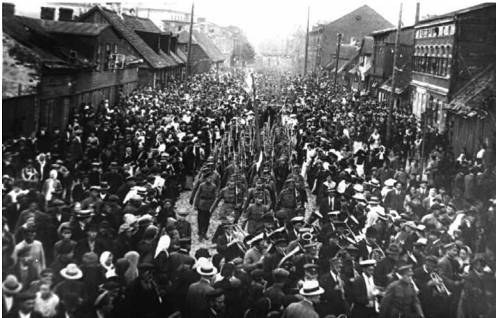
Liepājas iedzīvotāji vēro Latvijas Pagaidu valdības gājienu. 1919. g. 27. jūnijs